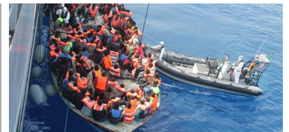
Migranti, sbarcati in 37 sulle coste di Santa Maria di Leuca

Eurydice è la rete europea che raccoglie, aggiorna, analizza e diffonde informazioni sulle politiche, la struttura e l'organizzazione dei sistemi educativi europei. Nata nel 1980 su iniziativa della Commissione europea, la rete è composta da un'Unità europea con sede a Bruxelles e da varie Unità