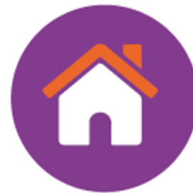
Tabella 1 – Distribuzione regionale Istituti Tecnici Superiori con area tecnologica prevalente Nuove tecnologie per il made in Italy - Sistema casa (valori assoluti)