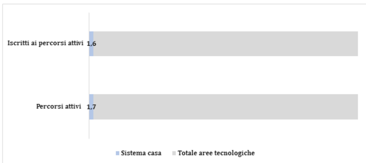
Grafico 1 – Percorsi attivi e iscritti ai percorsi attivi del Sistema casa sul totale aree tecnologiche (valori percentuali)