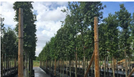
La ESB Group dona 32 alberi alla città di San Salvo