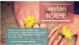
"Genitori insieme", un valido aiuto a San Salvo per chi ha figli adolescenti