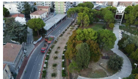
Alberi tagliati e colate di cemento, le critiche di Articolo Uno