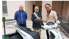
Il "Duck" tra storia, cultura e futuro FOTO