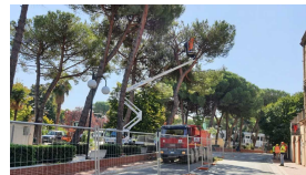
Il PSI di San Salvo sull'abbattimento dei pini: "The show must go on"