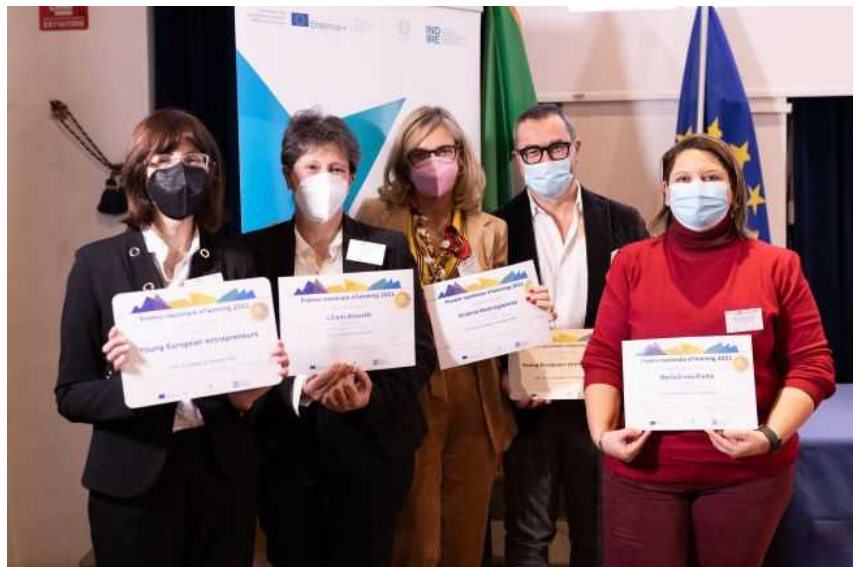
Nella regione una scuola si aggiudica il premio nazionale eTwinning 2021

BARI – Aprirsi a una nuova didattica innovativa basata su progettualità, formazione, scambio e la collaborazione, in un contesto multiculturale. Sono questi in estrema sintesi i progetti di collaborazione didattica tra scuole europee eTwinning , che si realizzano attraverso la più grande community europea dedicata all'apprendimento online. In Puglia l'azione europea registra negli ultimi anni un trend di crescita continuo.