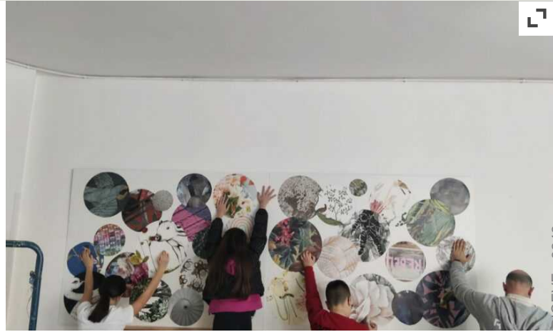
^ L'I.C. "Imbriani-Salvemini" fa scuola di inclusione: inaugurate due aule speciali

Spazi fruibili destinati ad implementare, stimolare e differenziare le esperienze di apprendimento: un'aula montessoriana ispirata al principio del "se faccio, imparo" e un'aula multisensoriale per esplorare i cinque sensi