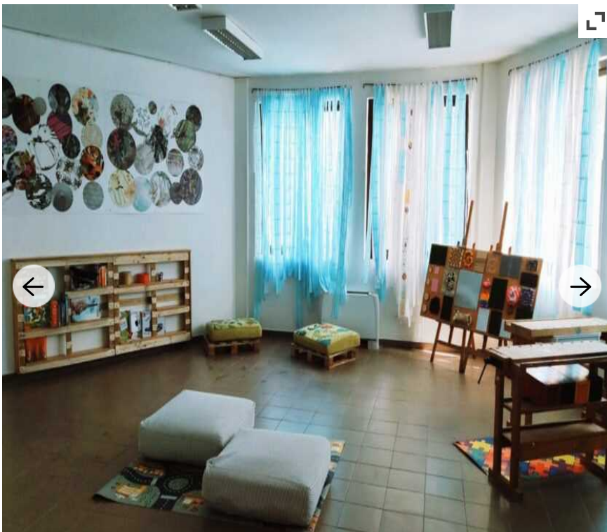
^ L'I.C. "Imbriani-Salvemini" fa scuola di inclusione: inaugurate due aule speciali