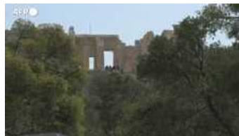
▶ Grecia, siti archeologici chiusi nelle ore più calde