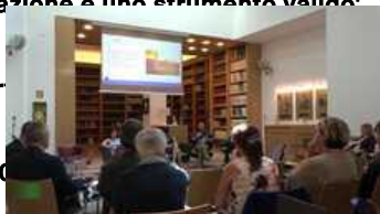
▶ Caldo, Inail presenta progetto per prevenire i rischi nel posto di lavoro