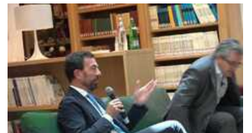
▶ Caldo: 4800 richieste di Cig nel 2022, in aumento a luglio 2023