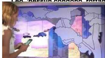
Tutte le news > ▶ Nasce a Torino i-Muse, la app per visitare i musei con l'AI

15:48 Lea: nessun condono, rottamazione è uno strumento valido