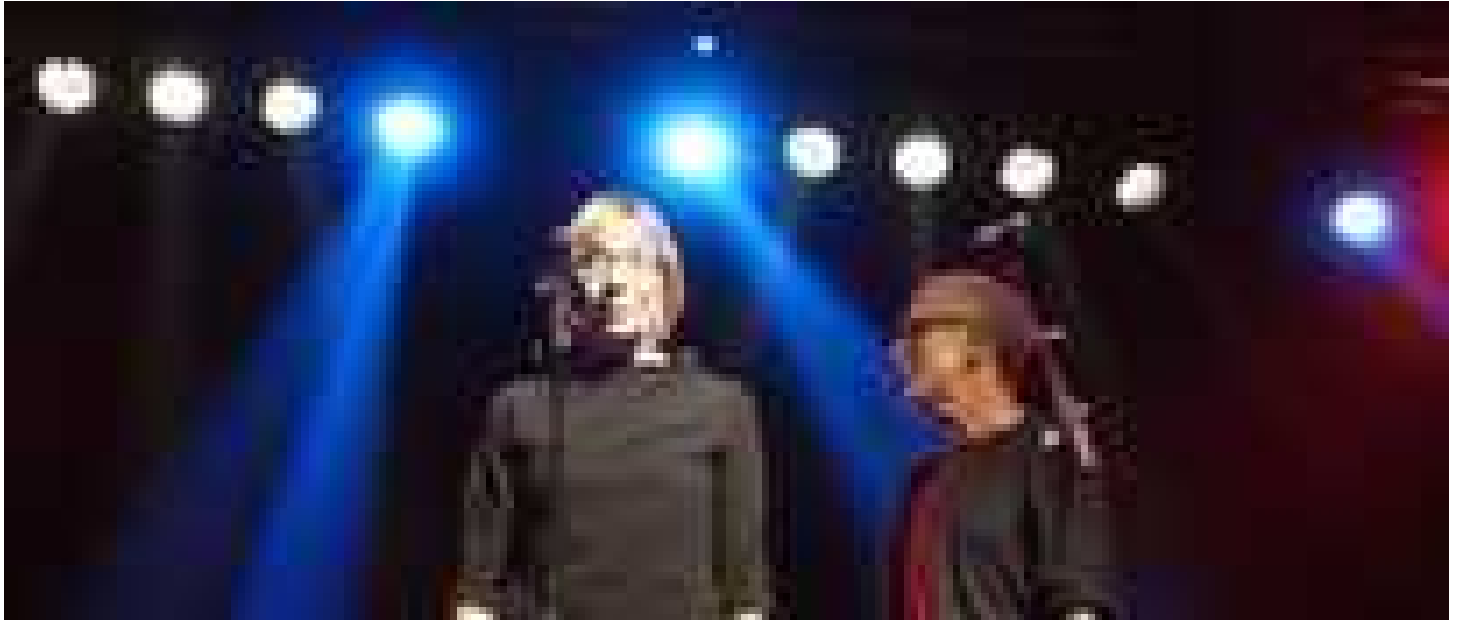
È morta Chicca Gobbi, la moglie di Francesco De Gregori