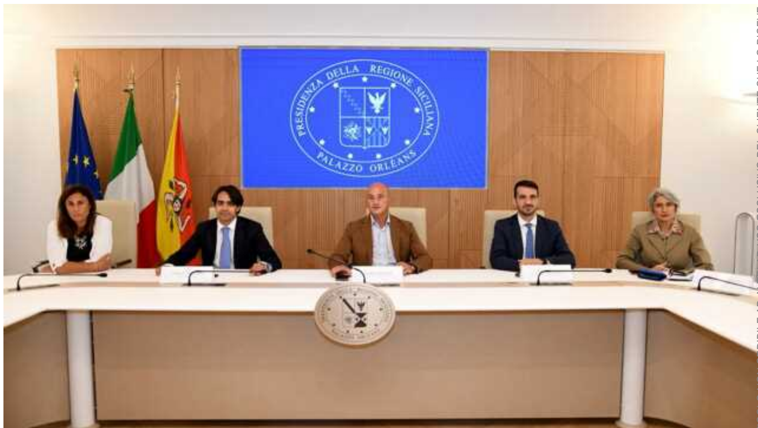
Un momento della presentazione