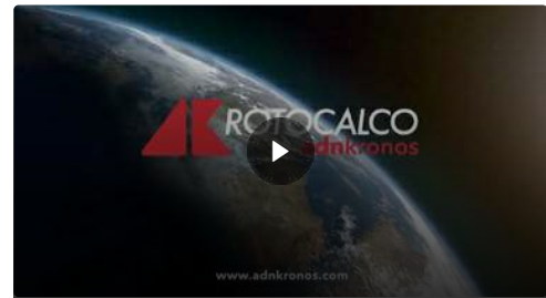
Rotocalco n. 41 del 12 ottobre 2023