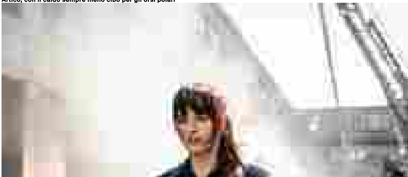
Dakota Johnson: 'Le donne si sostengono a vicenda'