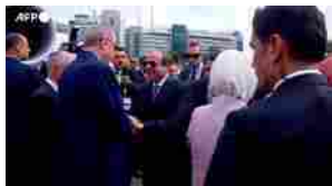
Lutte le news > Erdogan al Cairo, e' la prima visita da oltre un decennio

Con stralci e 3 rottamazioni magazzino fisco giù di 112 miliardi