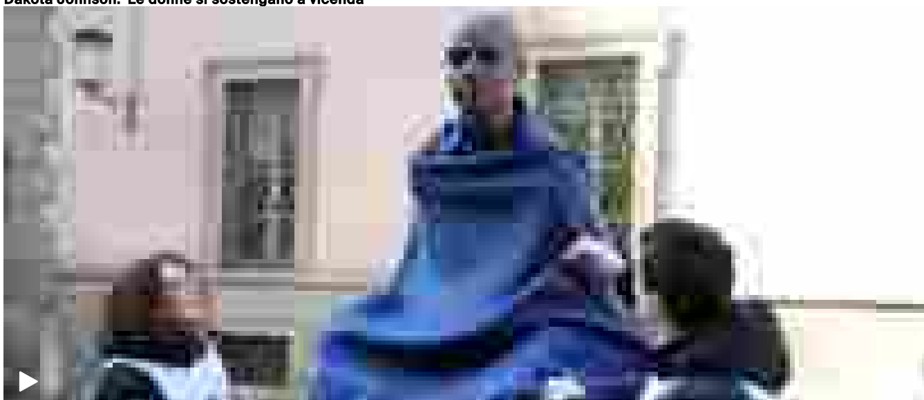
Statue avvolte dalle coperte per sensibilizzare sul senzatetto

Temi caldi Israele Vittorio Cecchi Gori Cisterna di Latina Samarate San Valentino