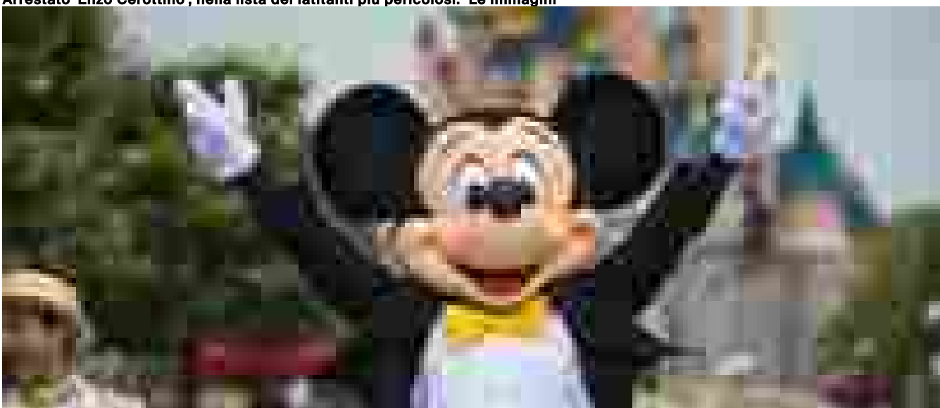
Topolino e Pluto vogliono il sindacato a Disneyland

Ritaglio stampa ad uso esclusivo del destinatario, non riproducibile.