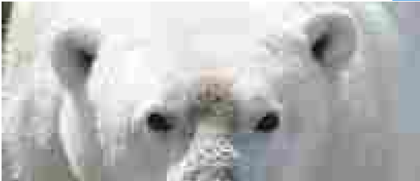
Artico, con il caldo sempre meno cibo per gli orsi polari