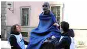
Milano, statue avvolte da coperte per sensibilizzare sul tema dei senzatetto