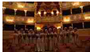
Presentata la "Maria" del Carnevale di Venezia