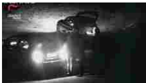
Arrestato 'Enzo Cerottino', era nella lista dei latitanti pericolosi. Le immagini della cattura