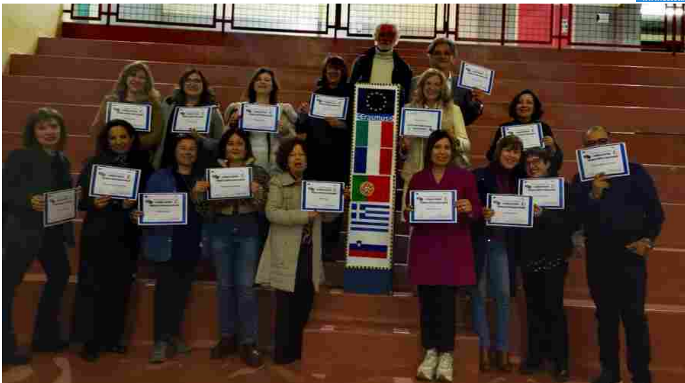
pubblicato il 27 marzo 2024 alle 14.42