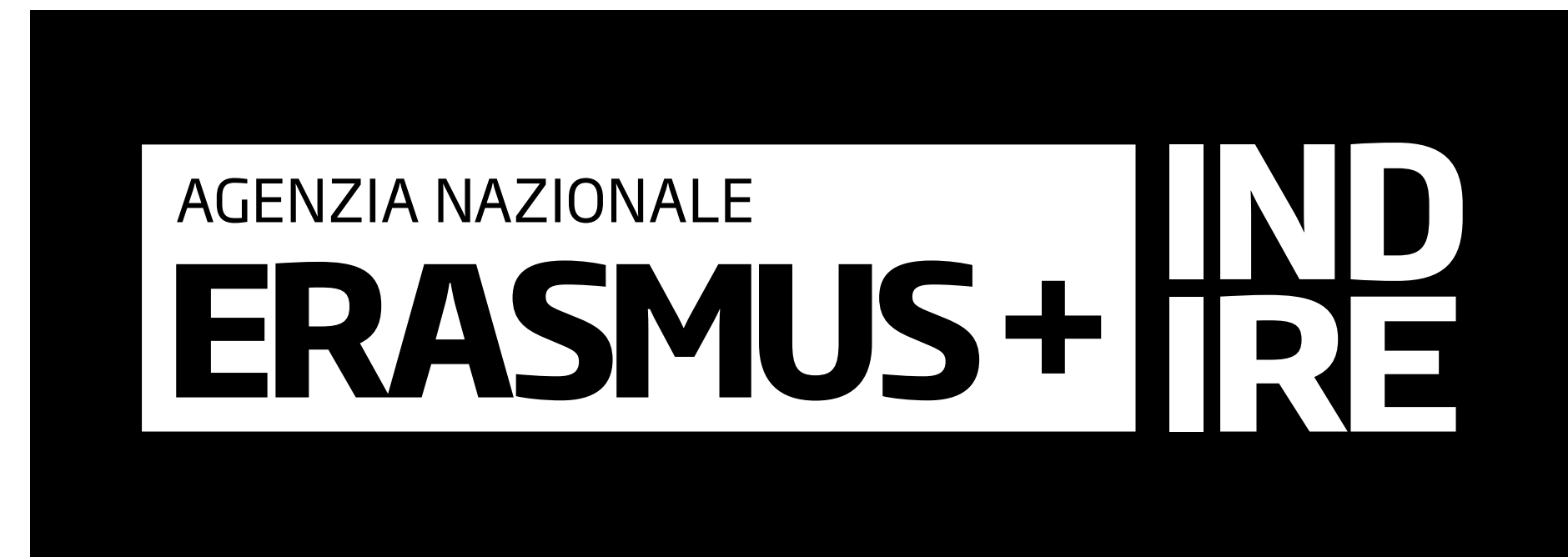
Versione 1 colore - bianco