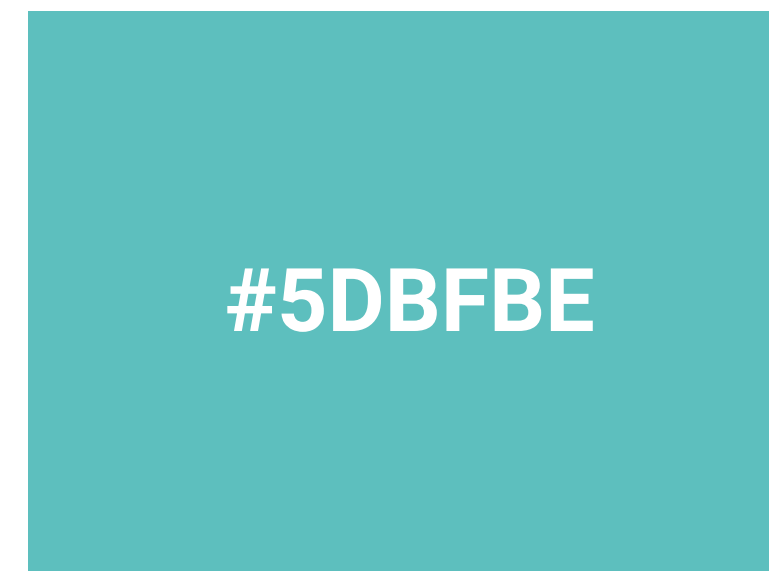
Colore settore Scuola