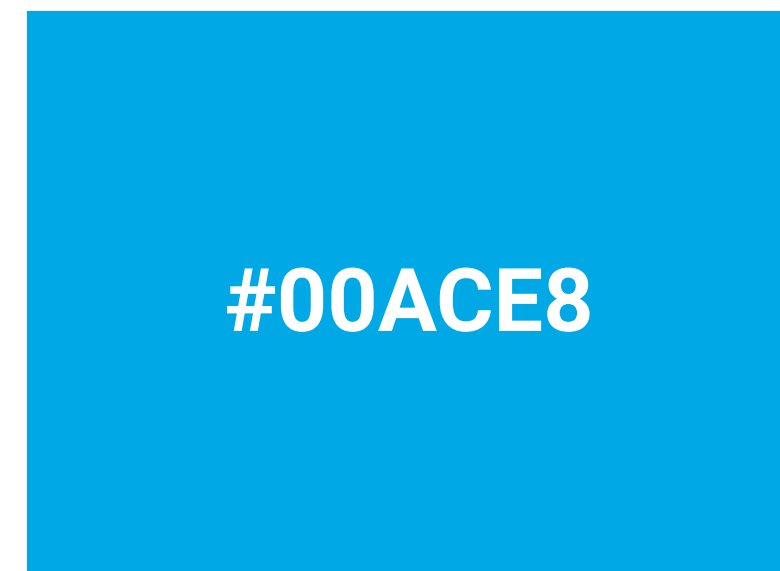
Colore programma Erasmus+