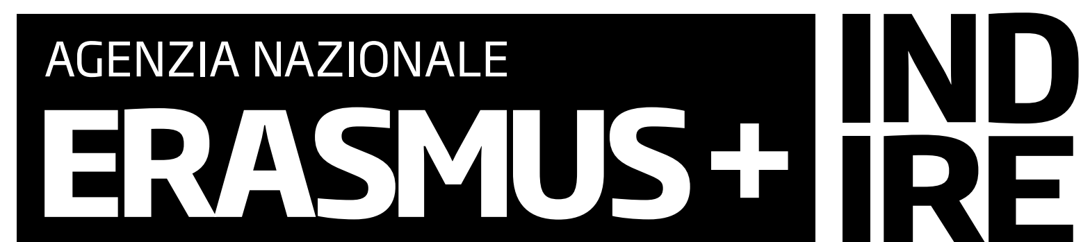
Versione 1 colore - nero