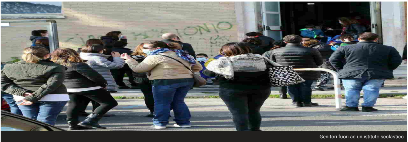
Genitori fuori ad un istituto scolastico

Il territorio si attesta al secondo posto su scala nazionale. Più incoraggianti i dati dell'infanzia, che tocca il 20%